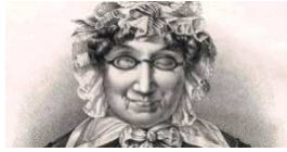
Pietje (haar roepnaam voor intimi en haar bijnaam 'Pietje Potentaat')